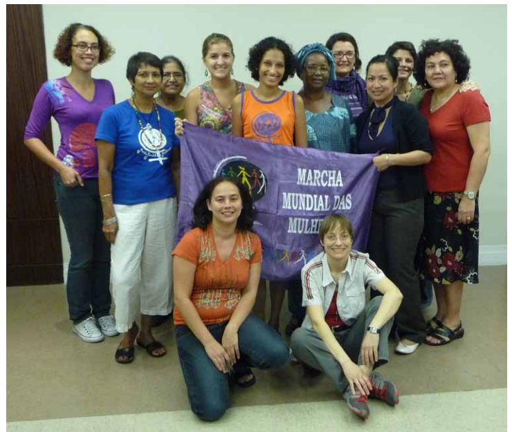
La première réunion du CI après la rencontre internationale de Galice à discuter la crise et a finalisé les textes vers l'action de 2010.

En vue de l'Action internationale de 2010, non seulement les textes mais aussi la