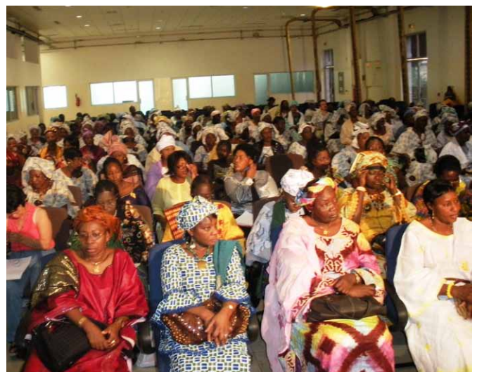
Femmes de plus de 20 pays de Afrique ont participé à la Ire Rencontre régionale Africaine de la MMF

La Rencontre s'est ouverte avec les interventions des organisatrices et des autorités nationales, suivies de manifestations culturelles. Les travaux se sont poursuivis avec un débat sur le contexte sociopolitique actuel (crise financière, économie mondialisée, les alternatives de l'Afrique). Pour ce qui est des alternatives il