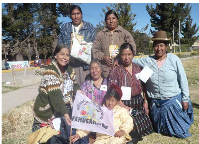
Les membres des groupes de la MMM à Guatemala et au Pérou ont participé au reencontré.

30 morts (vous pouvez en lire plus sur le lien : http://www.marchemondiale.org/news/mmfnewsitem.2009-06-11.1947480103/es )