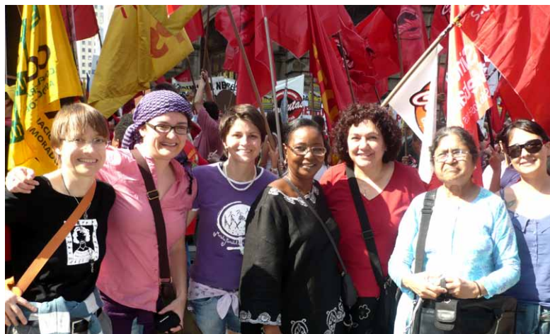
À São Paulo, les integrantes du Comité international de la MMF ont participé à la manifestation organisé le 30 mars par les syndicats et les mouvements sociaux dans le pays.

A l'occasion de cette semaine, il y a eu des manifestations dans divers pays