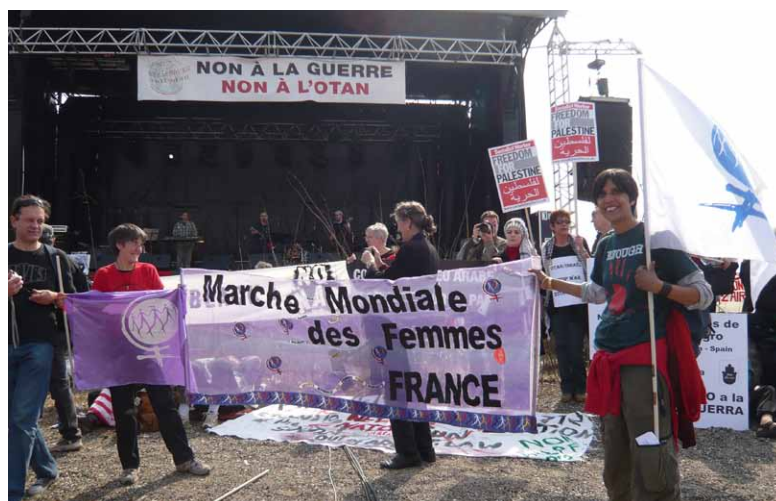
La MMF a été présent à Strasbourg avec des militants de la France, de Macédoine et Royaume-Uni.

Le 12 octobre marque l'arrivée des Espagnols dans les Amériques. Dans ce continent, sous l'influence des peuples indigènes, cette date est devenue la journée contre l'ethnocide découlant de la conquête,