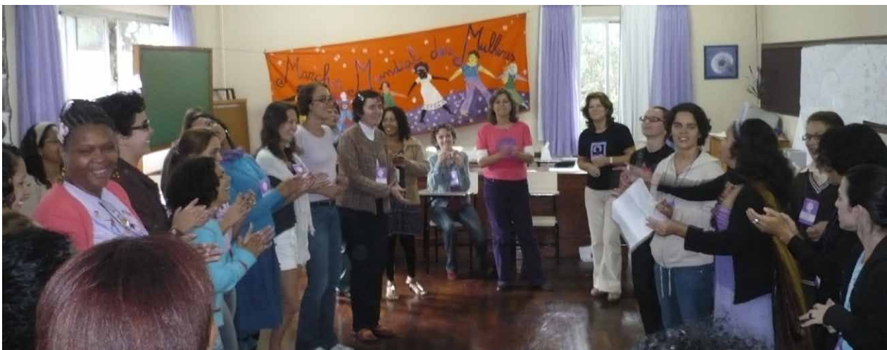
Commissions ont été mis em horaire de travail et de préparation par le progrès du Brésil vers 2010.