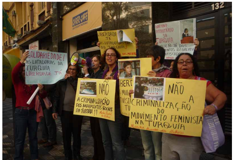
Des manifestations devant les missions diplomatiques en Turquie ont eu lieu en Suisse, Brasília et São Paulo (photo), au Brésil.