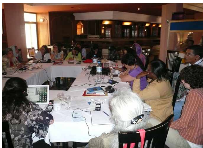
Résistance à l'occupation étrangère et au conservatisme religieux patriarcal ont été discutés lors du séminaire de Rabat.

Pendant le Séminaire de préparation du Forum Maghreb Machrek il y a eu un atelier sur la situation des femmes dans la région, habitée par des peuples arabes, amazigh, berbères, entre tant d'autres. Autour de 30 femmes de divers pays ont échangé sur l'histoire des luttes féministes et la vie quotidienne des femmes dans leurs pays. Les luttes des femmes sont liées aux luttes de libération nationale, surtout pendant les années 1960 - 1970 et à la résistance contre l'occupation étrangère, jusqu'à aujourd'hui.