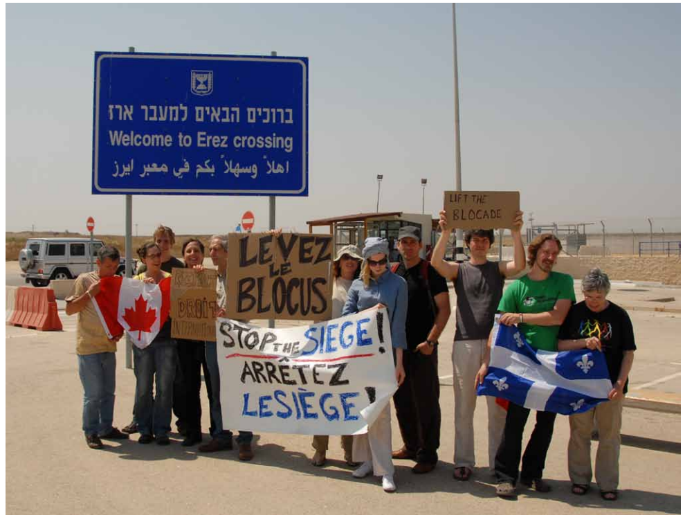
Une délégation canado-québécoise de 14 organisations de la société civile dont la FFQ et la Marche mondiale des femmes a séjourné en Palestine occupée et en Israël du 13 au 28 mai dernier pour développer des liens de solidarité avec la population palestinienne. Ici manifestation de la délégation au poste frontière d'Érez suite au refus des autorités militaires israéliennes de laisser entrer le groupe à Gaza. Ce geste s'inscrivait dans le mouvement international de sit-in pour faire lever le siège de Gaza

Pour la suite des choses. Notre solidarité avec ces mouvements de femmes palestiniens et israéliens peut de