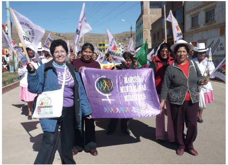
Les femmes de Femucarinarap, membre du MMF au Pérou, ont participé massivement dans le sommet de peuples indigènes, soit dans les rues soit dans les débats.

Les femmes autochtones des groupes membres de la MMF au Brésil, Chili, Guatemala, et surtout au Pérou ont été présentes à l'événement. Deux jours auparavant, l'Assemblée de la Femucarinarap - Fédération des femmes paysannes, artisanes,