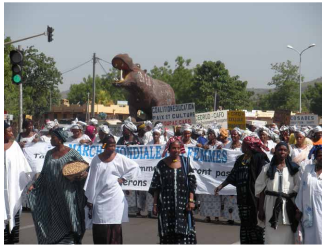
Le rencontre a finit avec une manifestaion dans les rues de Bamako

Les femmes ont partagé leurs expériences : les activités génératrices de revenus, l'implication des femmes dans les réformes agraires, la promotion de l'économie solidaire, le renforcement de capacités, l'élaboration et la vulgarisation du Code de la famille, le plaidoyer pour l'héritage, la scolarisation des femmes et des filles, l'alphabétisation, la promotion