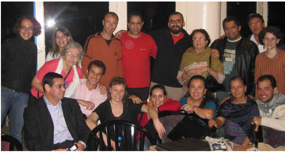
Activistes de l'Algérie, Belgique, Brésil, États-Unis, le Mexique et le Maroc participent des réunions de l'Assemblée des mouvements sociaux à Rabat (Maroc), en mai, à l'occasion de la réunion du Conseil international du FSM. Ils ont fait le bilan des mobilisations mondiales du premier semestre et ont discuté la préparation des prochaines actions.

et contre le capitalisme qui détruit la planète. La semaine de mobilisation s'achève le 16 octobre avec la Journée pour la souveraineté alimentaire. Entre autres actions, des manifestations dans plusieurs villes et à la campagne, des gardes devant les représentations de l'ONU et des forums de discussion sont programmés.