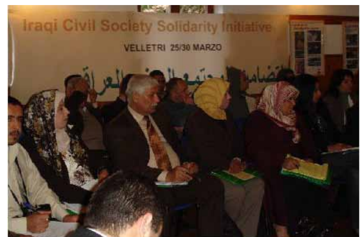
Les participants ont examiné les défis auxquels la société civile à l'Irak est confrontée.

Cinq groupes de travail (GT) ont aussi été réalisés organisés, l'un d'entre eux a discuté