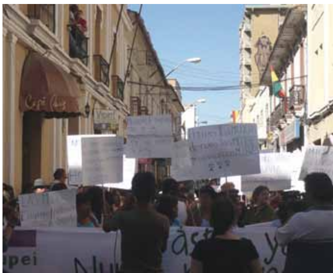
“Somos Todas Honduras” En las calles de Cochabamba para una manifestación de la hermandad y solidaridad de las mujeres

En la segunda parte de la tarde, realizamos un debate partiendo de la presentación del informe sobre la política de alianzas de la MMM, y luego dejamos la palabra a las representantes de los grupos aliados invitados a nuestro Encuentro,