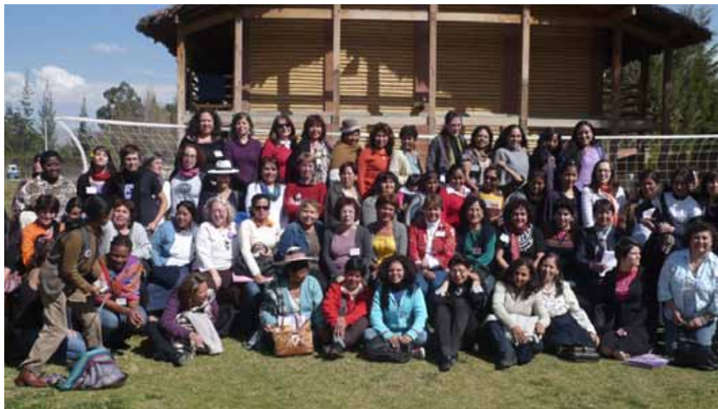
Participantes del II Encuentro Regional de las Américas, Cochabamba, Bolivia

Violencia hacia las mujeres: trabajar sobre la prevención de la violencia hacia