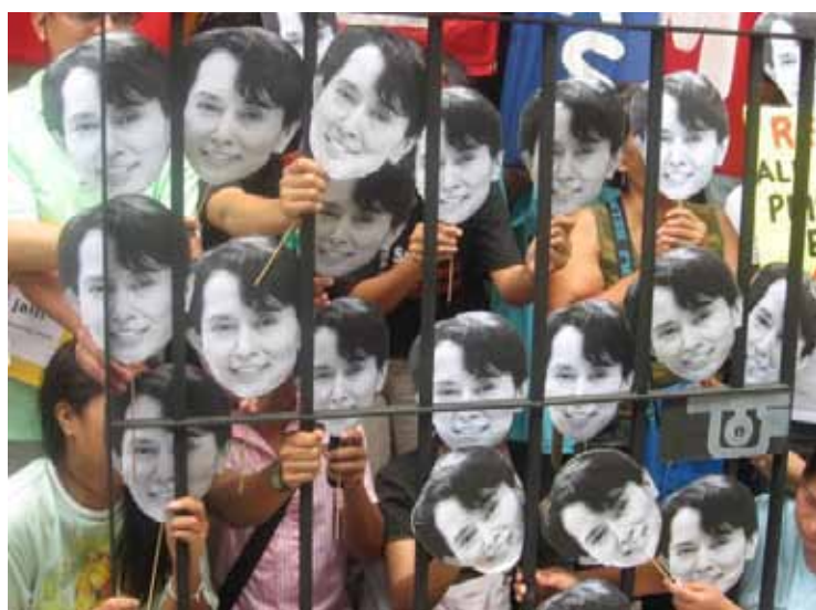
Las compañeras de la MMM-Filipinas protestan en contra a la más reciente pena de arresto (domiciliar) de Daw Aung San Suu Kyi en Burma

Daw Aung San Suu Kyi de Birmania acaba de ser sentenciada nuevamente por la junta militar a 13 meses de prisión domiciliaria. Antes de su sentencia, activistas de la Marcha Mundial de las Mujeres de Filipinas, lideradas por la Coalición contra el Tráfico de Mujeres - de Asia Pacífico (CATW-AP), la Alianza Laborista Progresista - Mujeres (APL - Mujeres) y el Colectivo Birmania Libre, para exigir justicia.