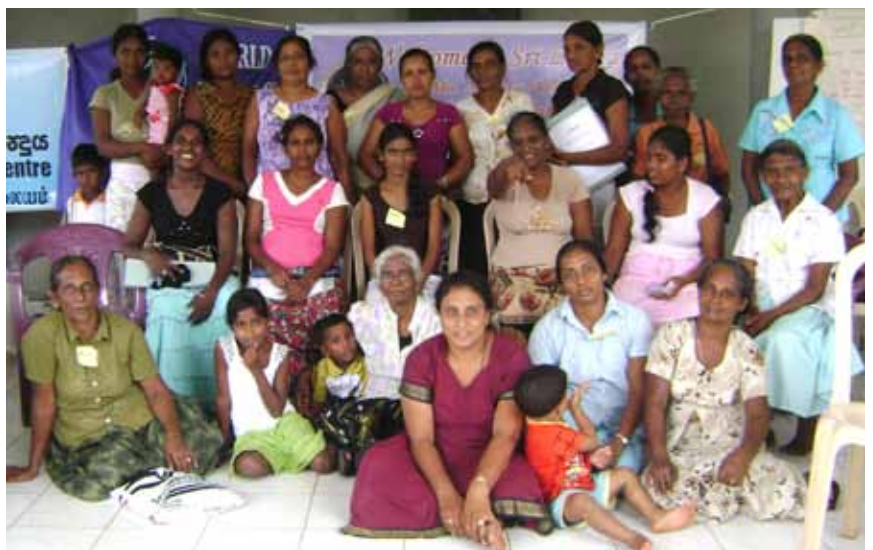
Las compañeras de Sri Lanka se reúnen para consolidar la MMM en su país

Con el fin de consolidar la coordinación nacional más reciente de la MMM, compañeras de organizaciones de base de Sri Lanka, se reunieron el 29 y 30 de junio en Thaladena Negombo, a 35km de Colombo, capital de dicho país. Las participantes del encuentro pertenecen a 18 organizaciones locales que representan a pescadoras y pescadores, comunidades locales y grupos de mujeres (como la Organización de Mujeres Unidas y la Organización de Amas de Casa). La reunión se desarrolló en Sinhala y en inglés, y contó con la ayuda de una de las participantes para la traducción.