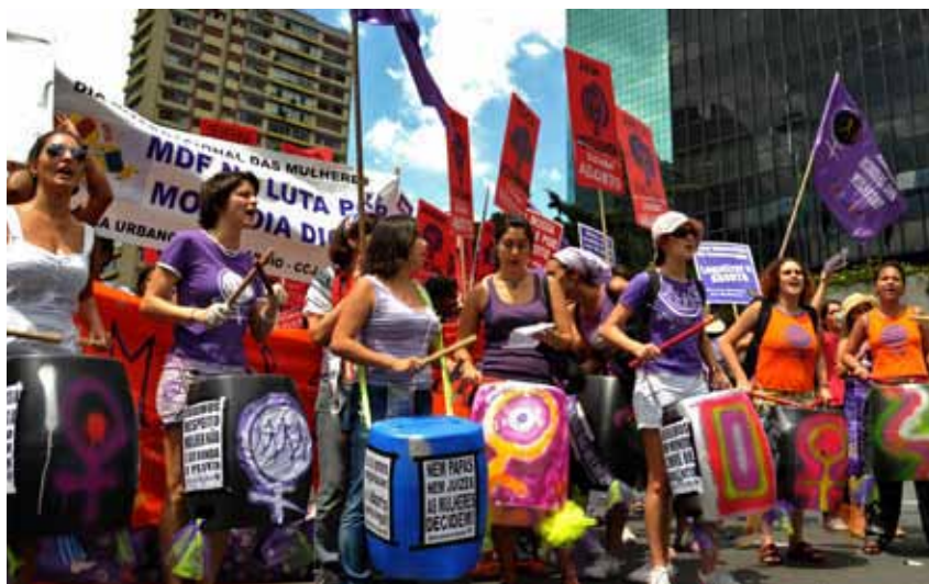
En 2010, vamos a ocupar las calles con colores, sonidos e irreverencia durante nuestra Acción Internacional

● Marchas y acciones simultáneas entre el 7 y 17 de octubre, con una movilización internacional a Kivu Sur en la República