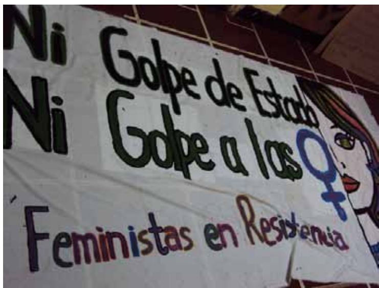
“Ni Golpe de Estado. Ni Golpe a las Mujeres” Las Feministas en Resistencia exigen el final de la violencia del Estado y de los hombres

En el transcurso del encuentro de las Américas, realizado entre los días 10 y 12 de agosto, ya se habían pasado 46 días del golpe, la misma duración de la heroica resistencia. Desde su formación, el Frente